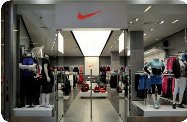
Arch. : Joanna Smagała