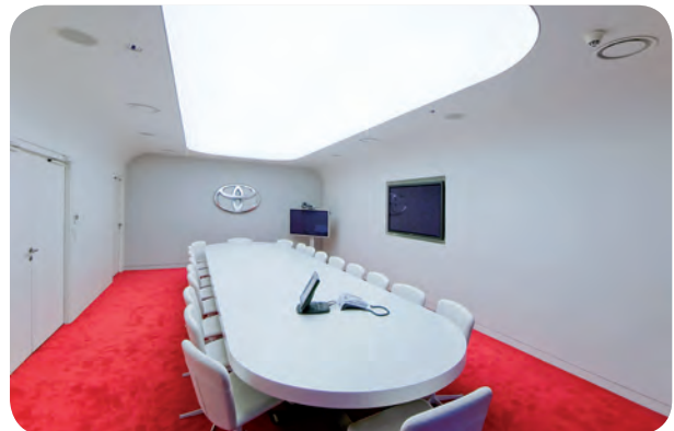
Arch. : Ora Ito