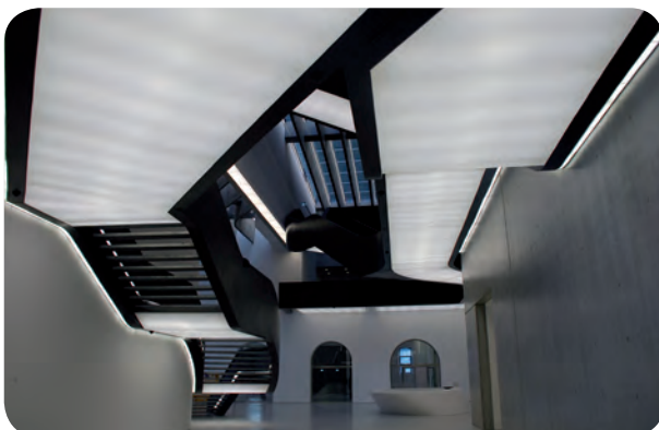
MaXXI Museum, Roma - Arch. : Zaha Hadid 2010 RIBA Stirling Preis