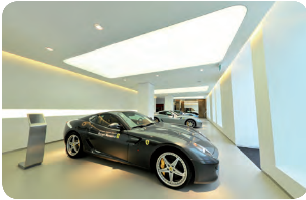
Arch. : S. Franci