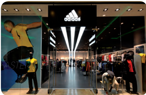
Arch. : Adidas International