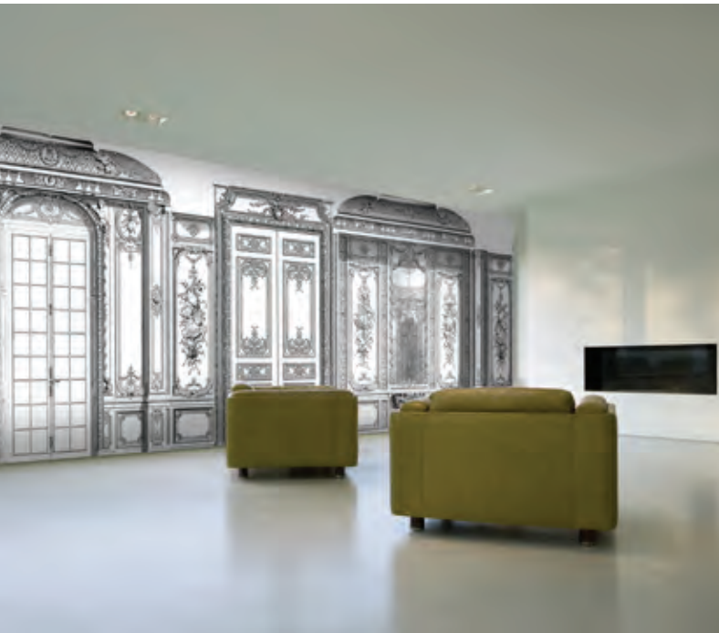
ref. BAE - Gravure - Chambre Marie Antoinette