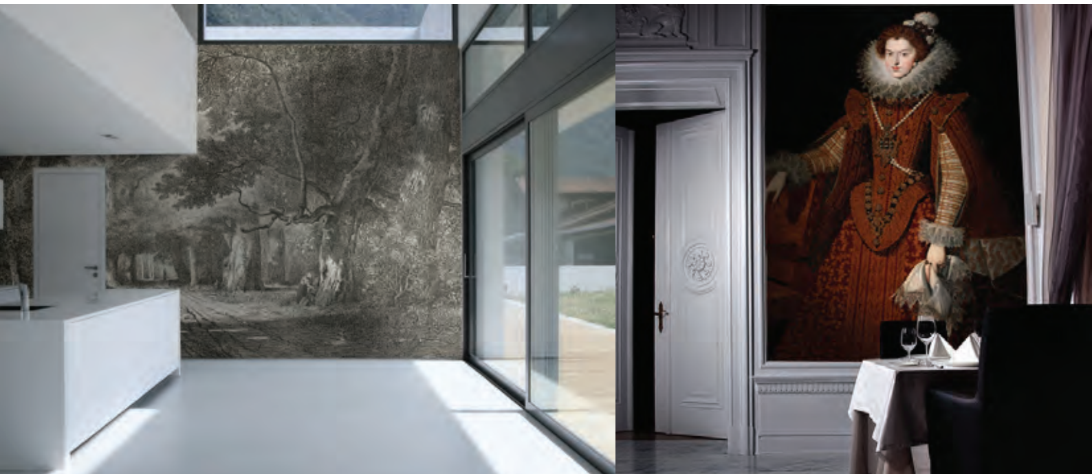
ref. Gravure ancienne - La forêt