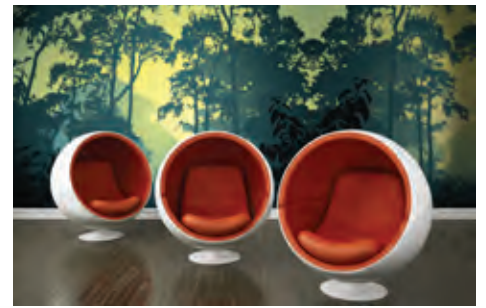
ref. Mulhousian spirit of panoramic scenery