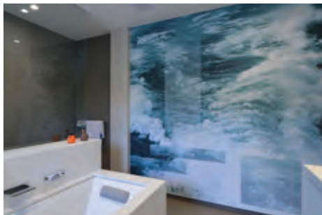
design Estrikor | Photo : Studio Rembrandt