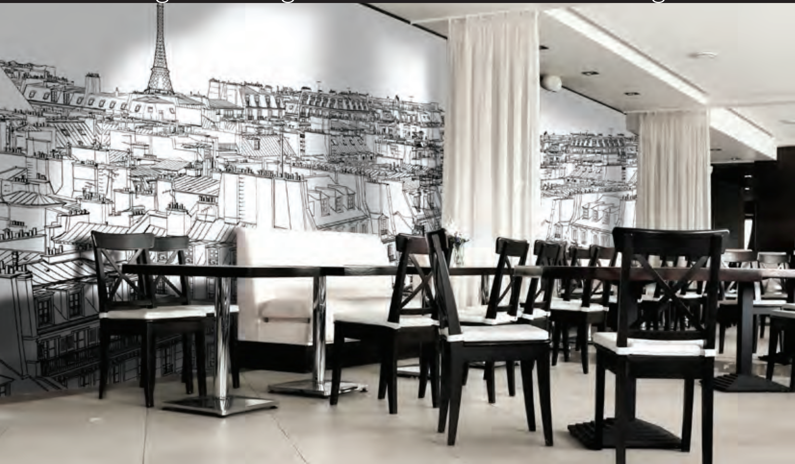
ref. City drawings - Les toits de Paris