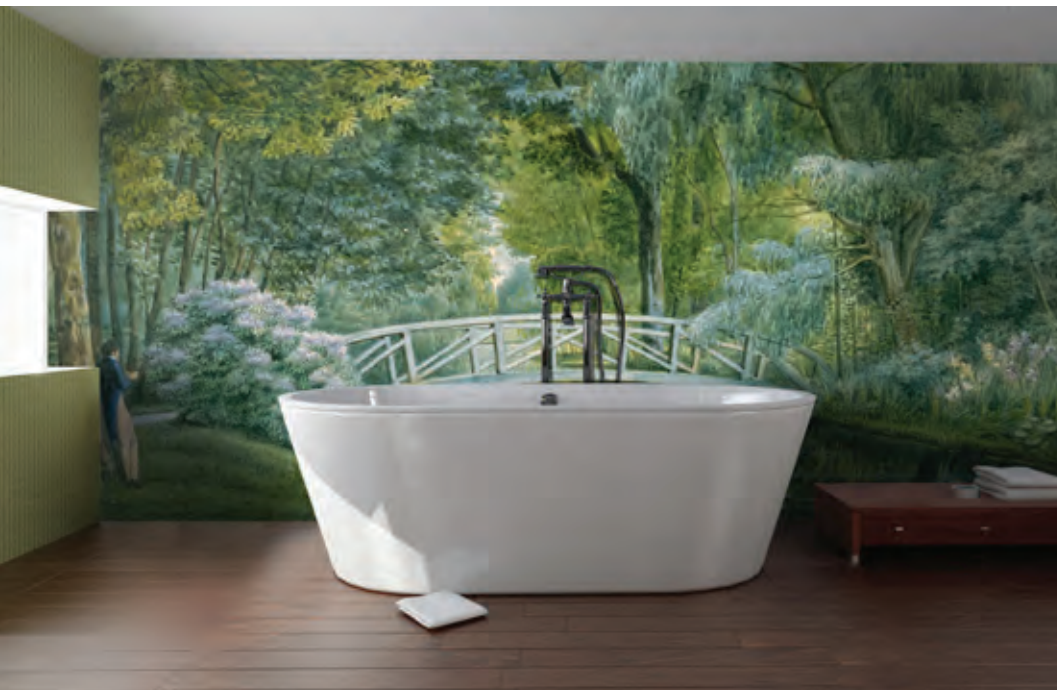
ref. BAE - Campagne anglaise XVIII ème