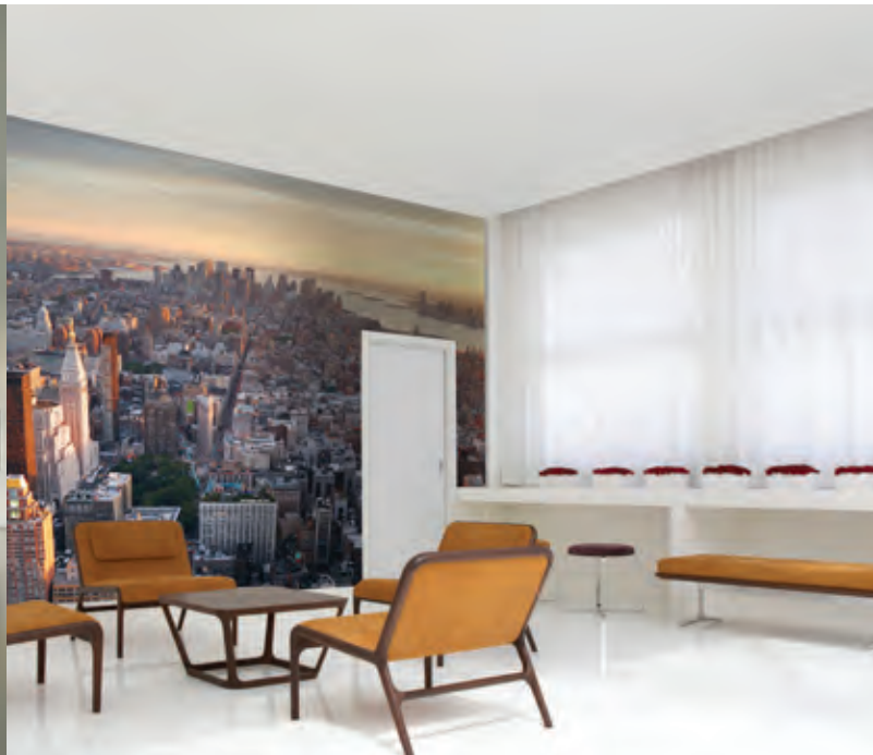
ref. Panoramique city view