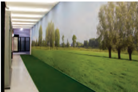
showroom Decoranda | arch. : Kurt Wallaeys

Die technische Bestandteile (Lichtschalter, Steckdosen...) werden in dem artolis ® . System eingebaut.