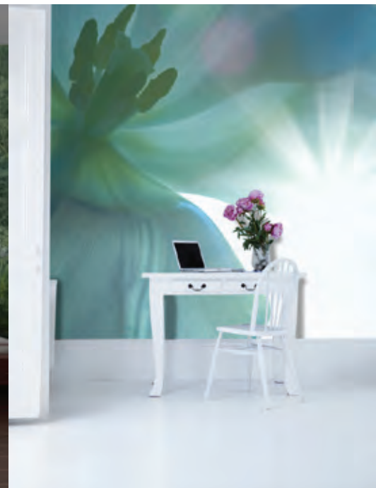
ref. BAE - Light &amp; Flower