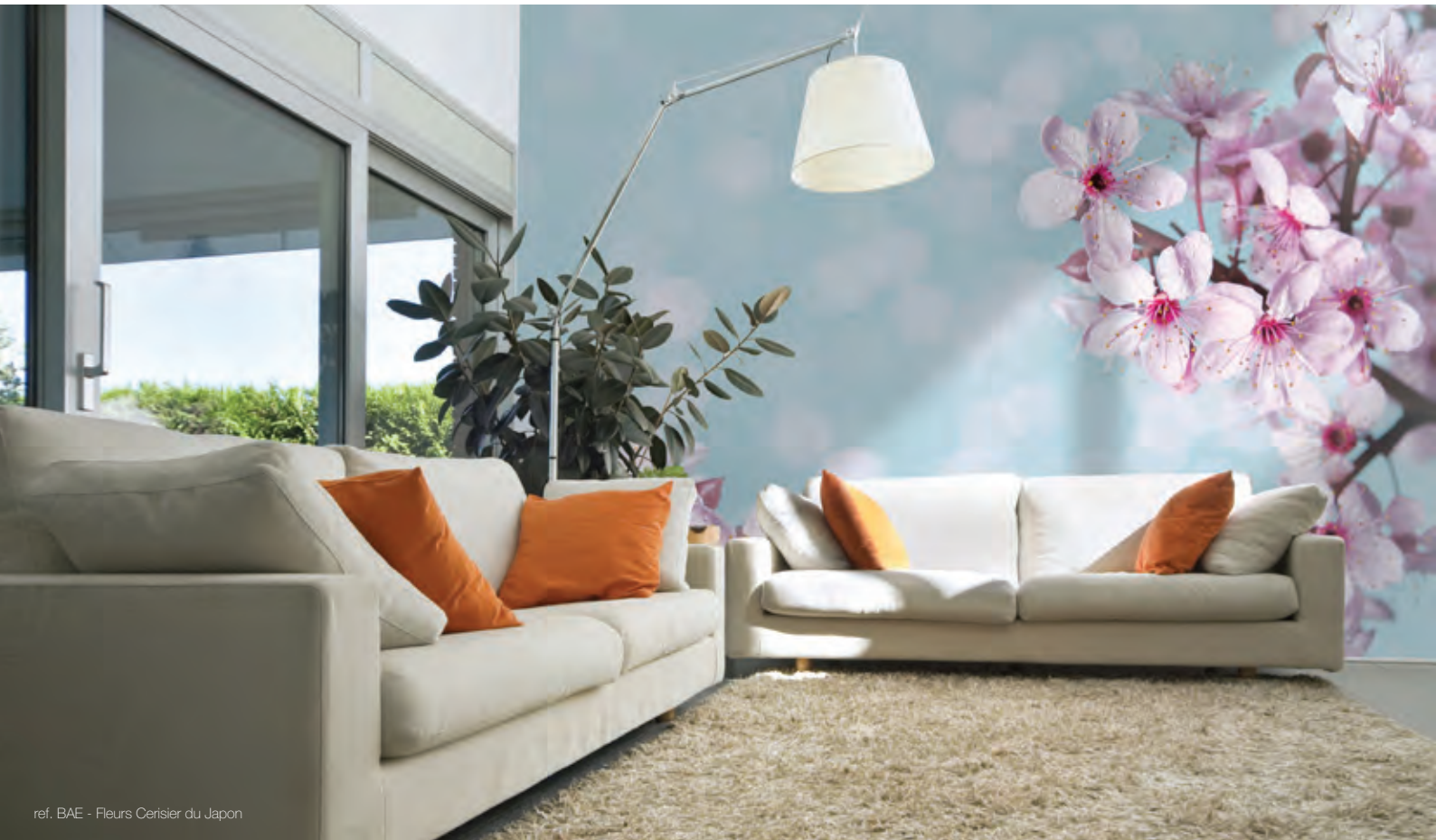
ref. BAE - Fleurs Cerisier du Japon